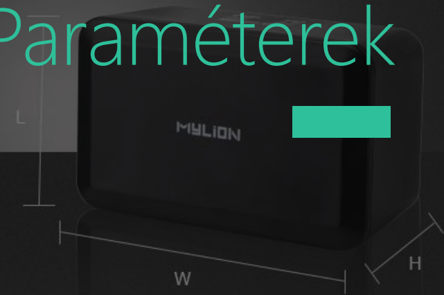
L112 x W70 x H60mm